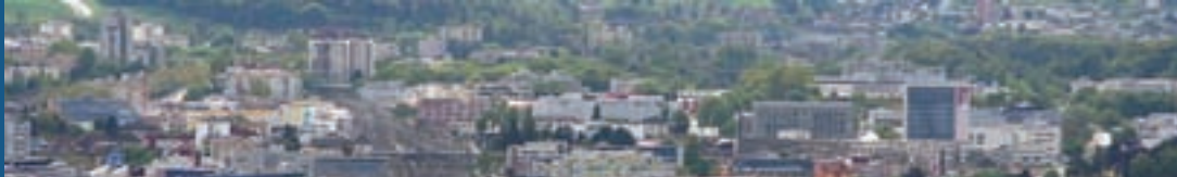
Bild oben: Die Stadt Schlieren, eine der grossen Ortschaften im Kanton Zürich.

auseinander liegen, will er sich die Finger nicht verbrennen.