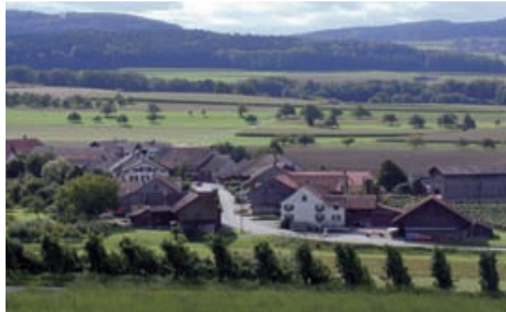
Volken – im Jubiläumsjahr des Gemeindepräsidentenverbands die kleinste Gemeinde des Kantons Zürich.

Das ist keine Selbstverständlichkeit. Der privatrechtliche Verein besitzt kein verbrieftes Recht, das der Kantonsregierung vorschreibt, ihn bei Vernehmlassungen und in praktisch allen wichtigen, die Zürcher Gemeinden betreffenden Fragen zu konsultieren. Dass der Regierungsrat trotzdem gegen seinen Widerstand wenig ausrichten kann – wie die NZZ wohl