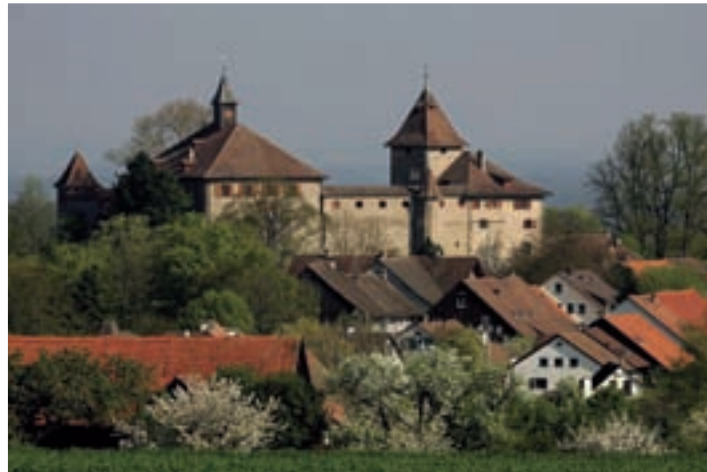
Finanzschwache Gemeinden wie Kyburg profitieren vom Finanz- und Lastenausgleich.

wieviel Wettbewerb erwünscht und gesund? Hier das richtige Mass zu finden, ist nicht immer leicht. Dem GPVZH kommt in diesem Prozess jeweils die wichtige Rolle des Mittlers zu: Er vermittelt unter den Gemeinden wie auch zwischen dem Kanton und den Gemeinden. Dass diese Aufgabe nicht immer leicht zu erfüllen ist, lässt sich