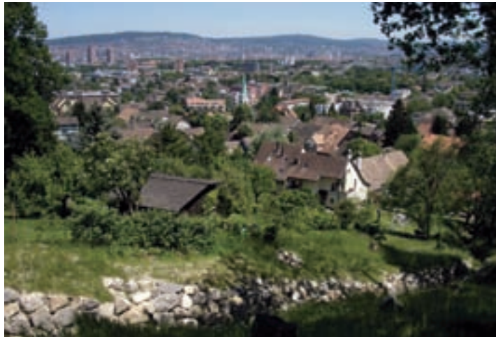
Albisrieden, einer der acht Vororte, die sich 1934 mit der Stadt Zürich zusammenschlossen.

Gemeinden jedoch zu trotzen. Mit 171 Gemeinden zählt der Kanton im Jahr 2009 noch genau gleich viele Gemeinden wie vor 75 Jahren. 1934 findet hier die letzte Gemeindevereinigung statt. Die acht Zürcher Vororte Affoltern, Albisrieden, Altstetten, Höngg, Oerlikon, Schwamendingen, Seebach und Witikon schliessen sich mit der Stadt Zü-