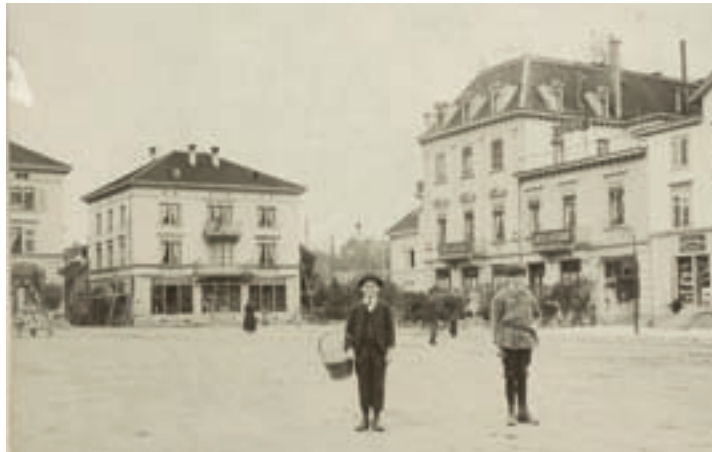
Im Usterhof (rechts) in Uster wurde der Gemeindepräsidentenverband gegründet.

band zu gründen: Den Verband der Zürcher Gemeindepräsidenten, kurz GPVZH. Viel zu diskutieren gibt das Vorhaben nicht. Die Anwesenden sind sich weitgehend einig: Die Schaffung des neuen Gremiums ist notwendig und sinnvoll. Denn es gibt viel zu tun in diesem Jahr 1909. Gleich drei wichtige Gesetze stehen an, zu denen die