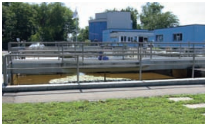
Die Abwasserreinigung, hier die Kläranlage Mönchaltorf, ist eine typische Aufgabe für Zweckverbände.

sen sich nicht aus. Stattdessen will der GPVZH die Möglichkeit von Gemeindezusammenschlüssen gleichberechtigt neben die Kooperation im Rahmen von Zweckverbänden oder die Schaffung von Einheitsgemeinden stellen. Denn für ihn gilt heute wie vor 100 Jahren: Die Gemeinden sollen ihre Zukunft autonom und frei planen können.